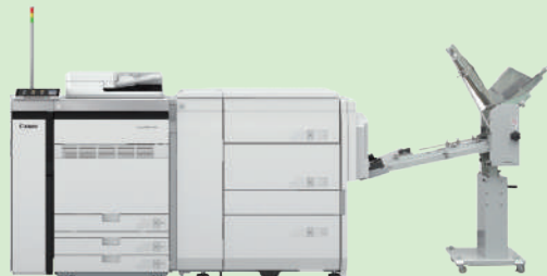
imagePRESS+多段デッキ V900・V800 封筒フィーダ UF-02K W1847×H1185×D872 W1100×H1560×D470