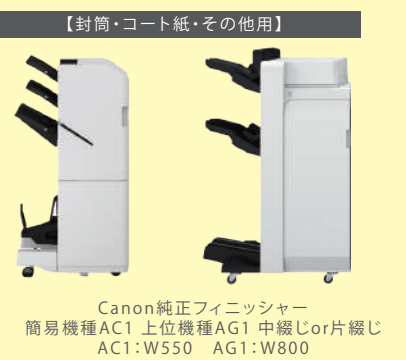
【封筒・コート紙・その他用】 Canon 純正フィニッシャー 簡易機種AC1 上位機種AG1 中綴じor片綴じ AC1:W550 AG1:W800