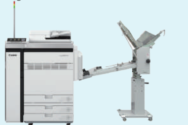
imagePRESS V900・V800 封筒フィーダ UF-02K W882×H1185×D872 W1100×H1560×D470